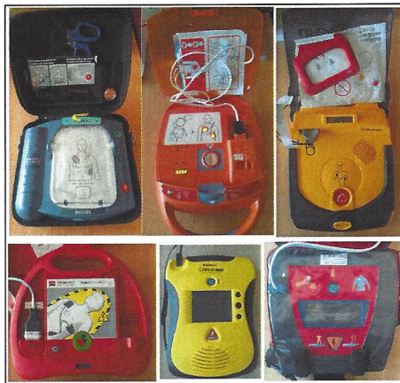
Abb. 2: Sechs der acht verwendeten PAD-Geräte (v.l.n.r.: Philips, Nihon Kohden, Physio Control (oben); Metrax, Defibtech, Schiller (unten)). Bereits auf den ersten Blick sind Unterschiede in der Gestaltung deutlich, auch hinsichtlich der Sprachanweisungen und Benutzerführung ergeben sich Abweichungen, deren Einfluss auf die Anwenderfreundlichkeit untersucht werden soll.

Erhoben wurden u.a. die Qualitätsparameter Zeit bis zur 1. Herzdruckmassage, Zeit bis zur 1. Schockabgabe, Perischock-Pause und No-Flow-Fraktion (Zeit ohne Herzdruckmassage geteilt durch die Gesamtzeit des Herz-Kreislauf-Stillstandes). Für alle Parameter wurden Mittelwerte und Standardabweichungen ermittelt und mit dem Szenario ohne PAD verglichen. Zusätzlich wurden T-Tests zum Vergleich der PAD untereinander durchgeführt.